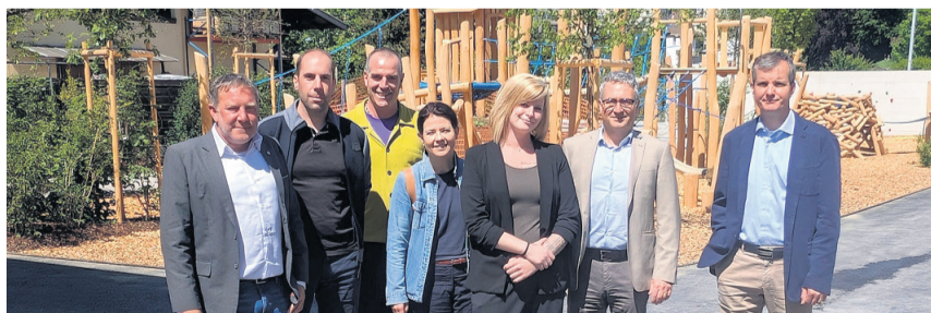
Die Verantwortlichen freuen sich über ein Gemeinschaftswerk.