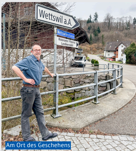
Am Ort des Geschehens